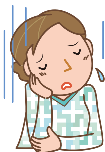
甲状腺ホルモン減少